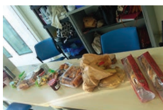
Le Centre E. Leclerc de Roques/Garonne – le 21 mars

Ce sont des associations, des restaurateurs, des entreprises, des particuliers. Au printemps ils ont offert aux médecins et soignants de l'Oncopole des repas, petits déjeuners, des œufs de Pâques, du café, du matériel de protection... Plus que des dons, des gestes solidaires qui ont profondément touché. Nous les remercions une fois de plus et sommes à leurs côtés dans une période qui chamboule aussi leurs activités.