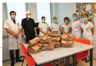
Les restaurant Aux Petits Frères – le 20 avril