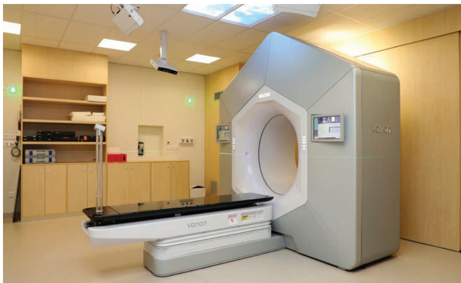
L'accélérateur Halcyon en fin d'installation.