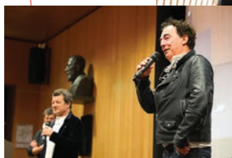
Les commerçants du marché Victor Hugo avec les Chevaliers du Fiel – le 17 avril