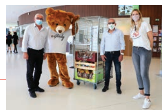
L'association les Gladiateurs – le 20 mai