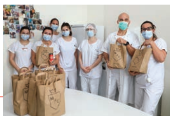
Le foodtruck les Mecs au camion – le 6 avril