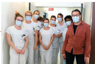
Le Chef Michel Sarran – le 27 mars