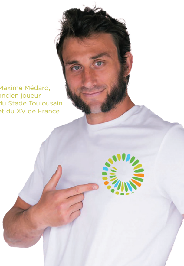
Maxime Médard, ancien joueur du Stade Toulousain et du XV de France

« Au rugby comme dans ma vie, j'ai toujours eu à cœur de me dépasser et de me lancer dans de nouvelles aventures collectives pour faire avancer des projets, faire grandir des équipes ou transmettre. En tant que parrain de l'Oncopole , mon rôle est de soutenir les actions et les équipes de l'Oncopole mais aussi d'encourager mes proches et mon entourage à se mobiliser pour faire avancer la lutte contre le cancer.