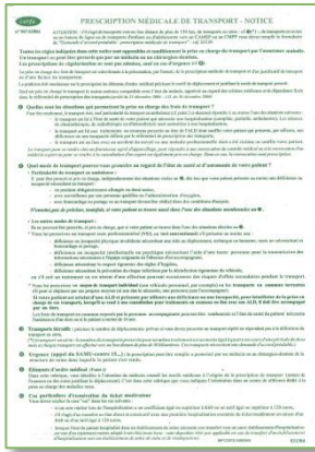
Prescription médicale de transport