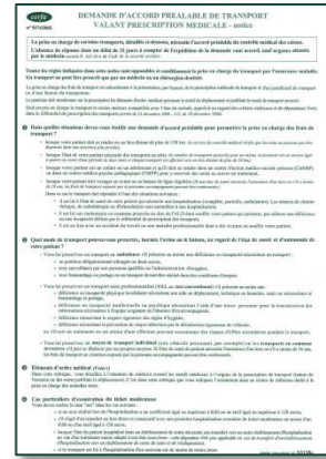
Demande d'accord préalable de transport